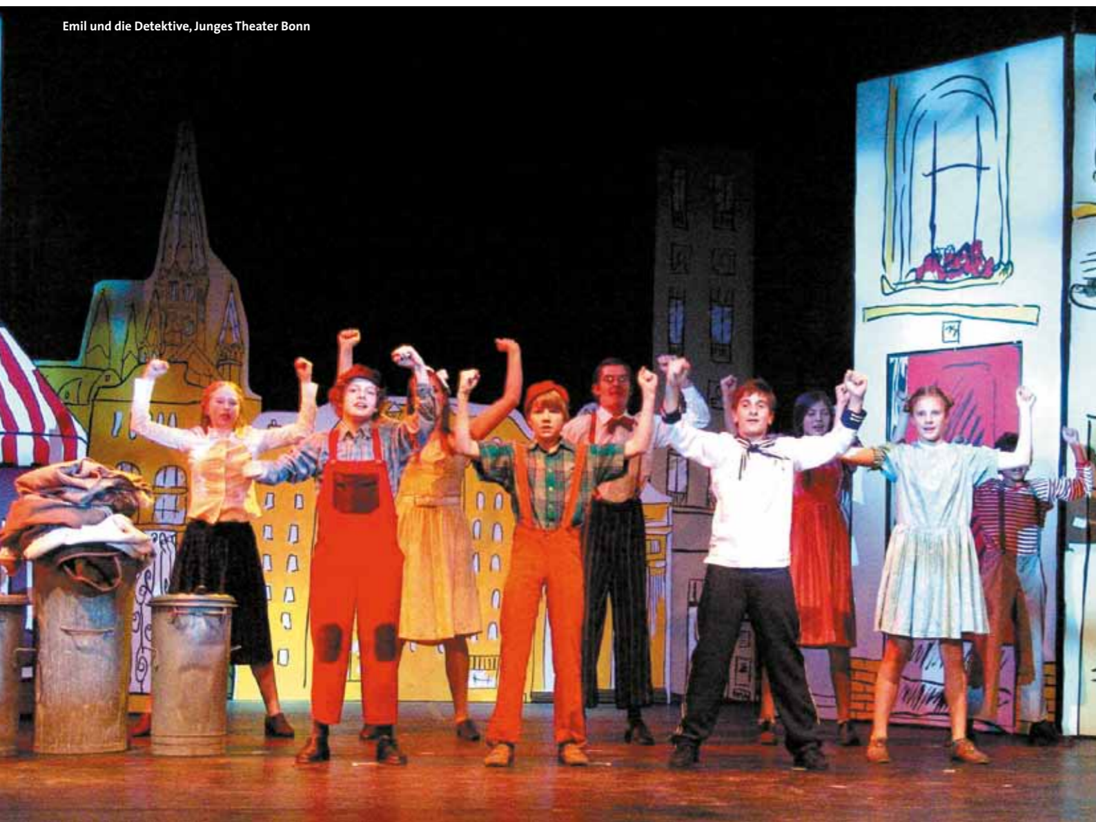
Emil und die Detektive, Junges Theater Bonn