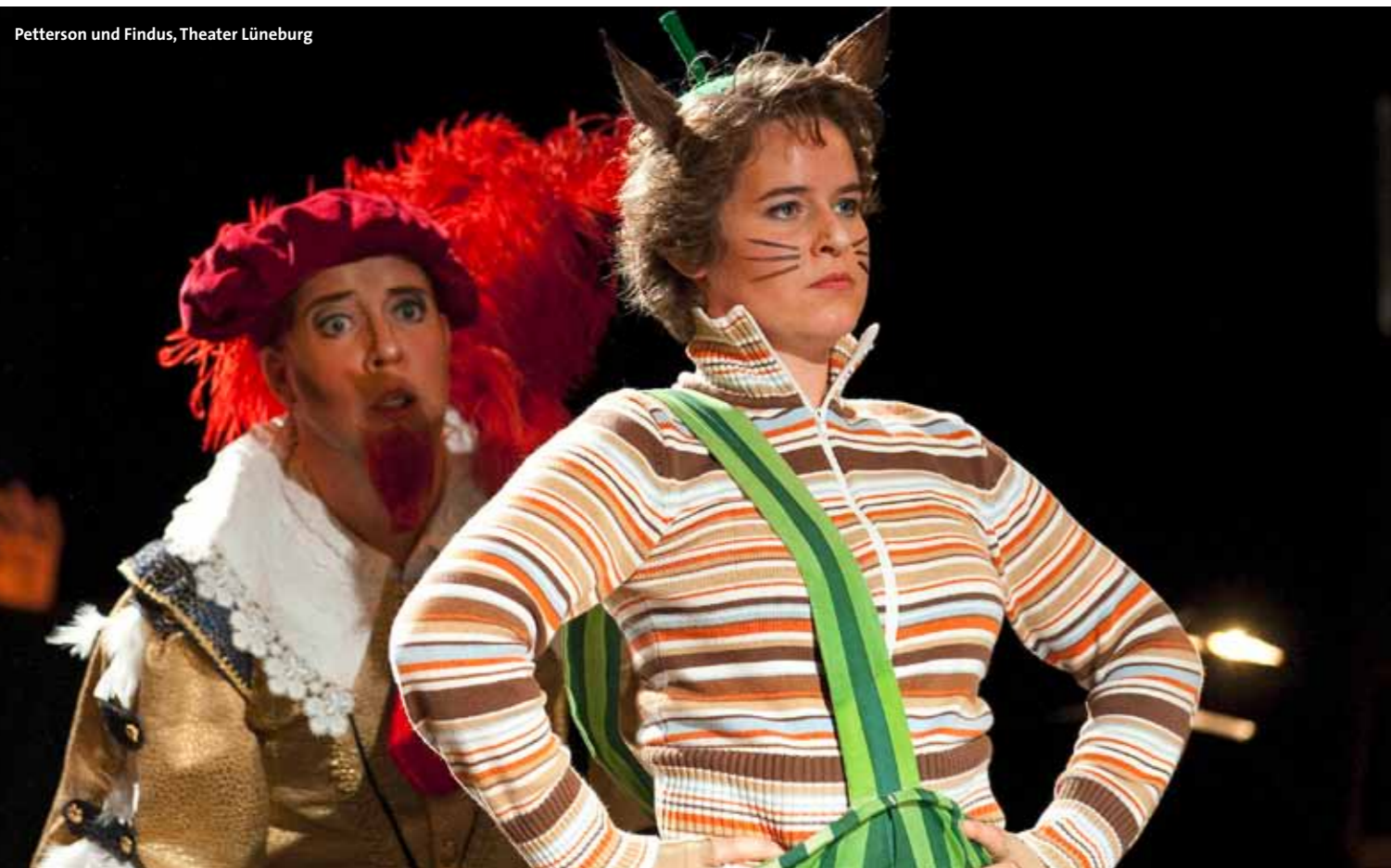
Petterson und Findus, Theater Lüneburg

Pippi Langstrumpf wohnt mit ihrem Pferd und dem kleinen Affen Herrn Nilsson in der Villa Kunterbunt und macht, was sie will. Sie ist superstark, herrlich unerzogen und lügt ganz wundervoll. Pippi triumphiert über Einbrecher, Lehrerinnen und Polizisten und ist für Tommy und Annika eine wunderbare Freundin.