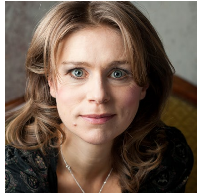
Katja Hensel © Sofafotografie